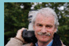
Yann Arthus-Bertrand www.goodplanet.org

"Nous avons besoin de grands projets ayant pour but d'éveiller le plus grand nombre aux problèmes environnementaux et sociaux auxquels nous sommes tous confrontés. Seule une prise de conscience collective provoquera le changement vers un développement durable. C'est la raison pour laquelle j'ai créé l'association GoodPlanet.org."