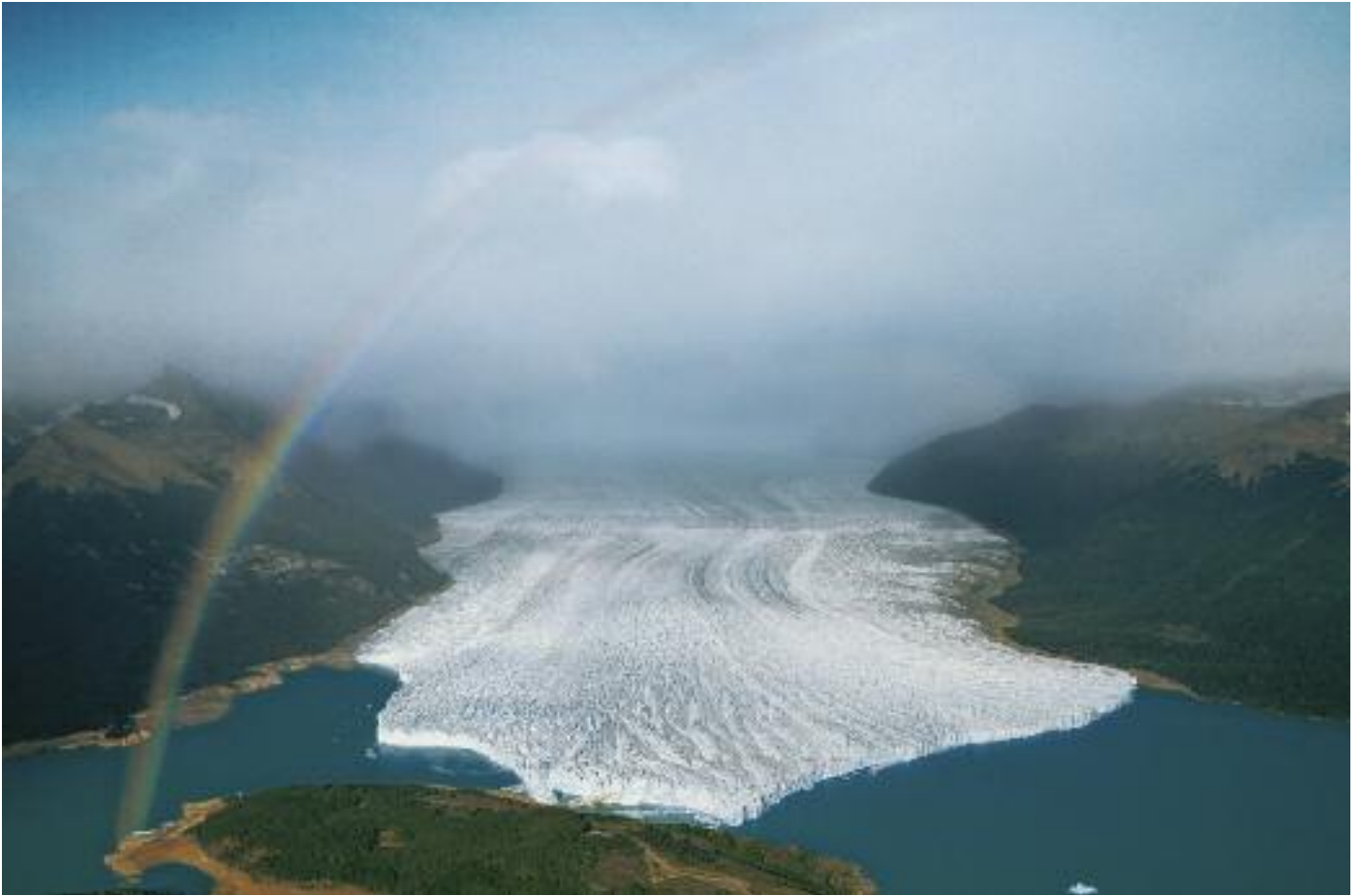
Glacier Perito Moreno, province de Santa Cruz, Argentine (50°28' S – 73°03'O) • © Yann Arthus-Bertrand /La Terre vue du ciel